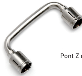
Pont Z connecteur F 45,3 mm