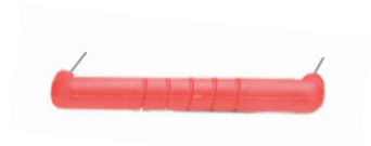
Pont d'alimentation 34,6 mm